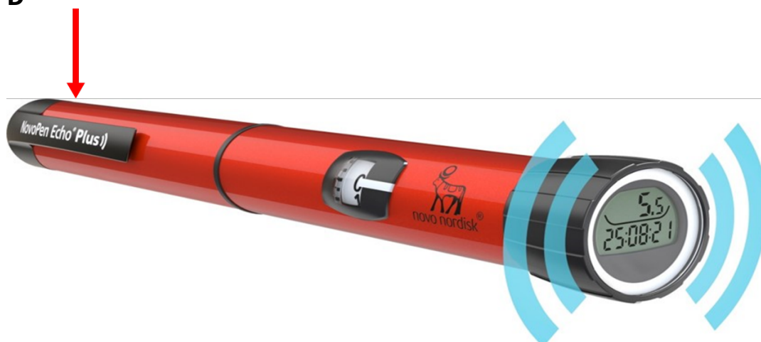
Figur 2. Den röda rutan visar var batchnumret är placerat på de påverkade pennorna, t.ex. batchnummer på pennan (A) är FV40067. NovoPen® 5 Plus (B), NovoPen® 6 (C) och NovoPen Echo® Plus (D).