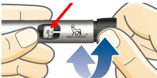
Figur 3. Exempel på dosräknare av påverkade injektionspennor.