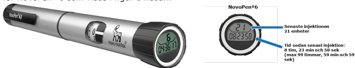
Figur 1. Injektionspennans dosminne på en NovoPen® 6. Dosminnet visar antal enheter på senast injicerade insulindos och tiden sedan senast injektion.

Dosminnet på alla pennorna ger användaren uppgifter om dosstorlek och tid sedan senaste injektion. Denna information visas på doseringsknappen på injektionspennan ex. för NovoPen® 6 som visas i figur 1 nedan.